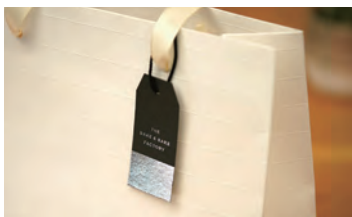
ショッピングバッグ