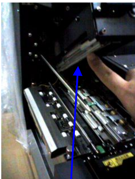
剥離版が降りた状態（金箔リボン用）

剥離版 (ヘッド左脇の丸い棒状の物) 降りている場合はヘッドに密着 している状態です。