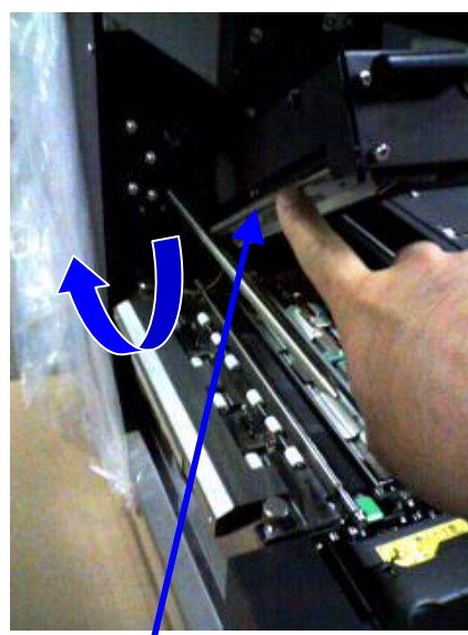
剥離版を上げた状態（通常用）

剥離版 (ヘッド左脇の丸い棒状の物) 降りている場合はヘッドに密着 している状態です。